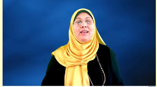
تركية# اللغة التركية# التركية مع ايساء# 6. selamlaşma - التحية في اللغة التركية

https://www.youtube.com/watch?v=sNSnUm6zJ2o