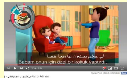
تعلم اللغة التركية عن طريق برامج الأطفال - 1

https://www.youtube.com/watch?v=rFlnBOB8gBI&list=PL1Z-Wx-u0vtKP26L2YuOsD2g4B4YbkYC2